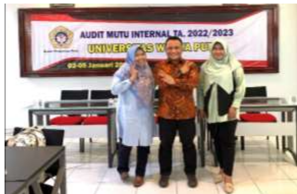
Gambar 1. 9 Program Studi Magister Hukum