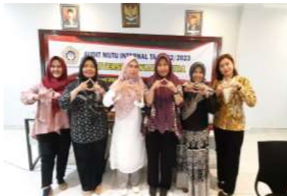
Gambar 1. 14 Program Studi Sastra Inggris