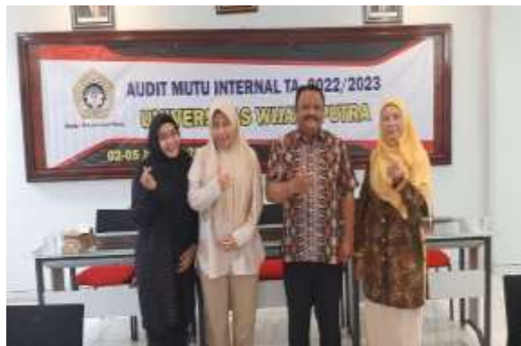
Gambar 1. 5 Program Studi Teknik Mesin