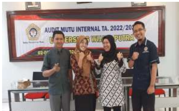
Gambar 1. 6 Program Studi Teknik Industri