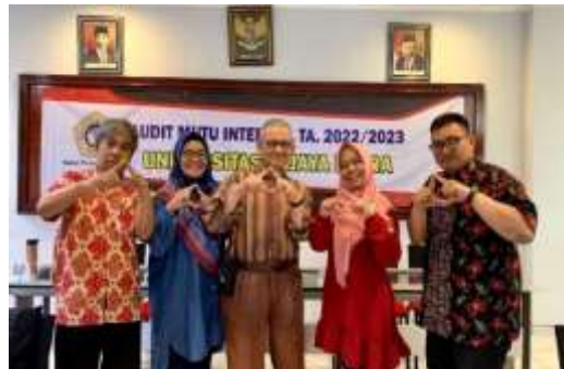
Gambar 1. 13 Program Studi Magister Administrasi Publik