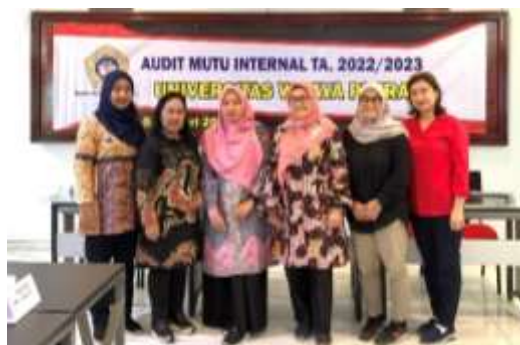
Gambar 1. 10 Program Studi Psikologi