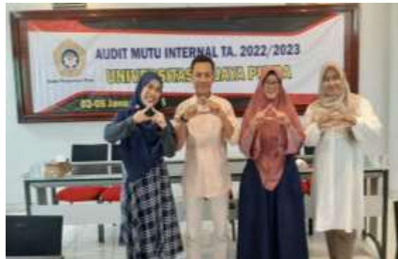
Gambar 1. 7 Program Studi Teknik Informatika