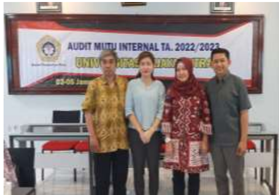
Gambar 1. 3 Program Studi Ekonomi Pembangunan