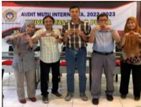
Gambar 1. 11 Program Studi Agribisnis