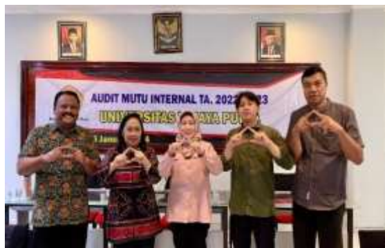
Gambar 1. 12 Program Studi Administrasi Publik