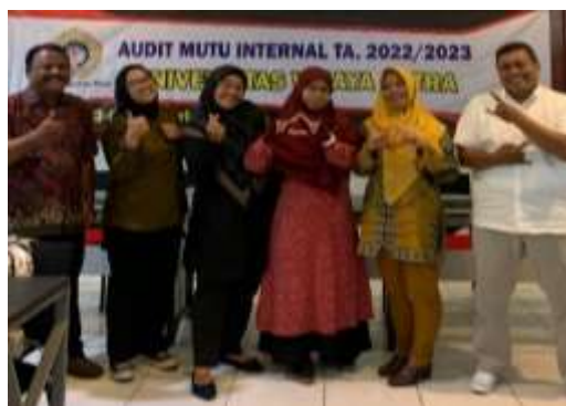
Gambar 1. 8 Program Studi Ilmu Hukum