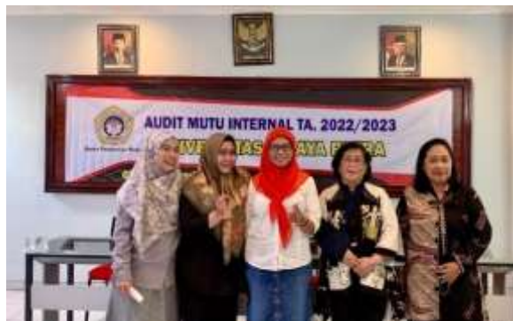
Gambar 1. 4 Program Studi Magister Manajemen