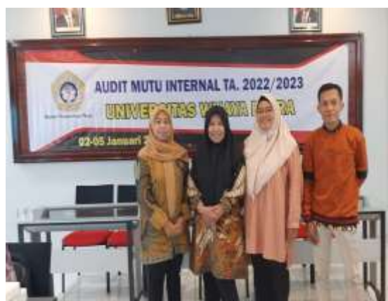
Gambar 1. 2 Program Studi Akuntansi