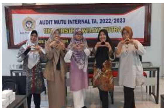
Gambar 1. 1 Program Studi Manajemen